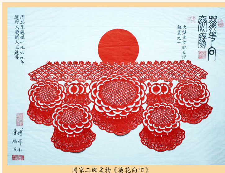
国家二级文物《葵花向阳》